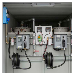
Pumpar med internt registreringssystem