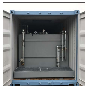
Spilltråg vid påfyllning