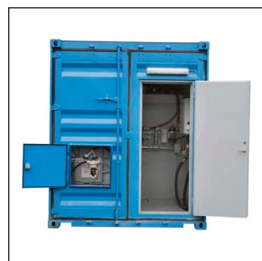
Lätt åtkomst till utrustningen