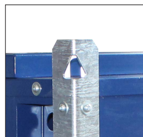
Kraftiga galvaniserade hörn.