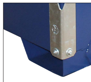
Gaffelfästen på alla fyra sidor.