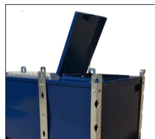
Enkel åtkomst av manluckan genom toppluckan.