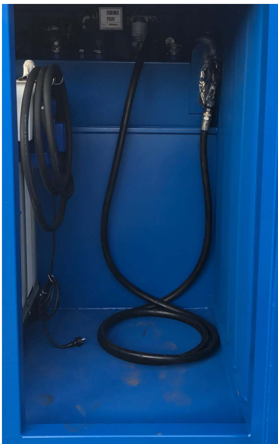
Gott om plats för utrustning